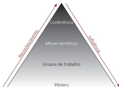
Figura 1 - Pirâmide reputacional dos eventos científicos

Como base nesta pirâmide, cada participante do evento científico atua conforme a autoridade que lhe é conferida; de modo que, a amplitude e relevância da sua comunicação corresponde ao seu prestígio e posição junto aos seus pares. Diante do exposto, entende-se que os eventos científicos não compreendem, simplesmente, reuniões e assembleias onde se compartilham informação e conhecimento, mas compreendem, também, espaços coletivos de mediação de autoridade, em que são expressos de forma ascendente (da base em relação ao topo) o reconhecimento e de forma descendente (do topo em direção à base) a influência.