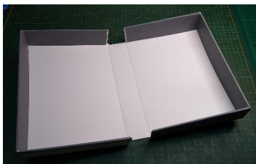
Figura 5 - Caixa semi-rígida, confeccionada em microondulado alcalino