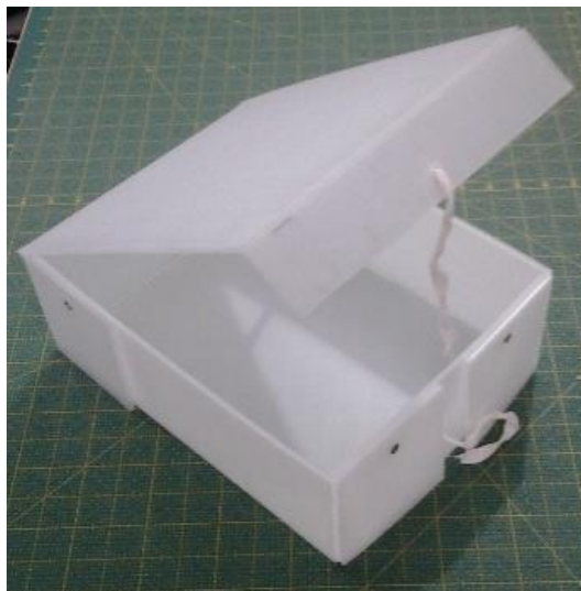
Figura 4 - Caixa rígida, confeccionada em plastionda