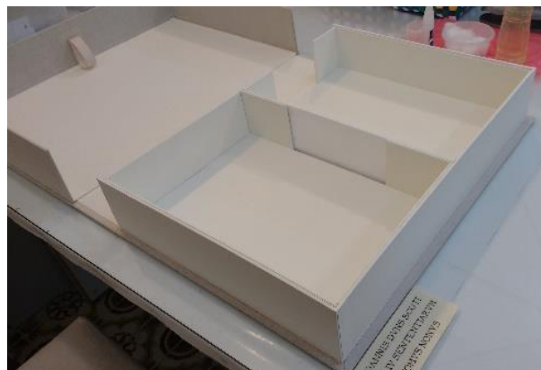
Figura 3 - Caixa rígida modelo Solander, confeccionada em papelão e revestida de papel neutro e linho