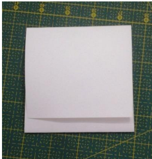
Figura 1 - Envelope em cruz ou quatro abas confeccionado em Filiset 80 g/m com pH neutro