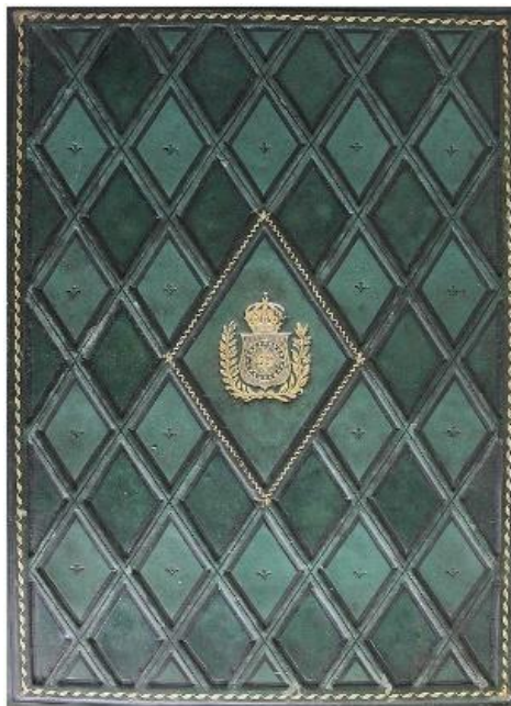
Figura 4 - Encadernação imperial