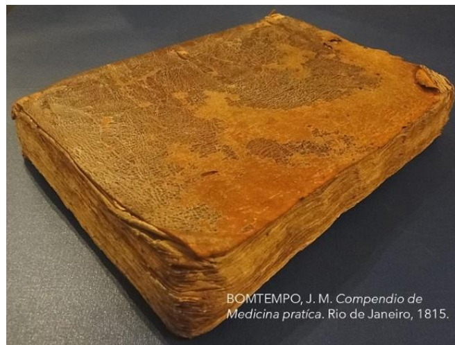
Figura 2 - As “orelhas” na borda das páginas, como marcas de leitura