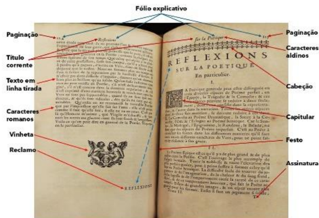
Figura 1 - Anatomia do livro (parte)