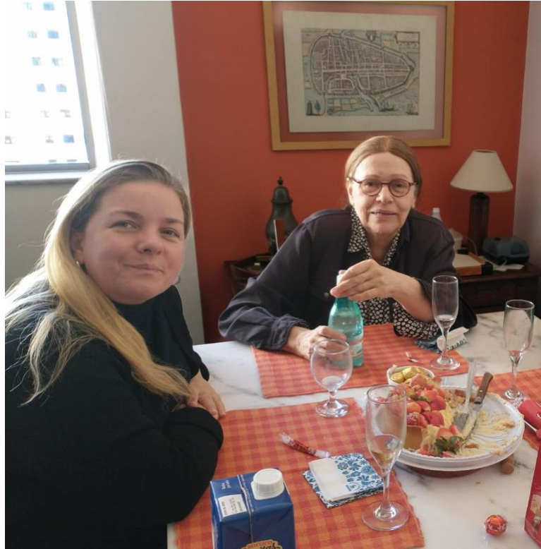
Imagem 4 - Nosso último encontro em 22 de julho de 2023.